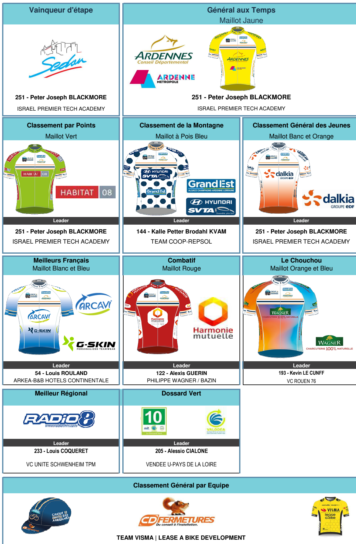
TABLEAU D'HONNEUR FINAL