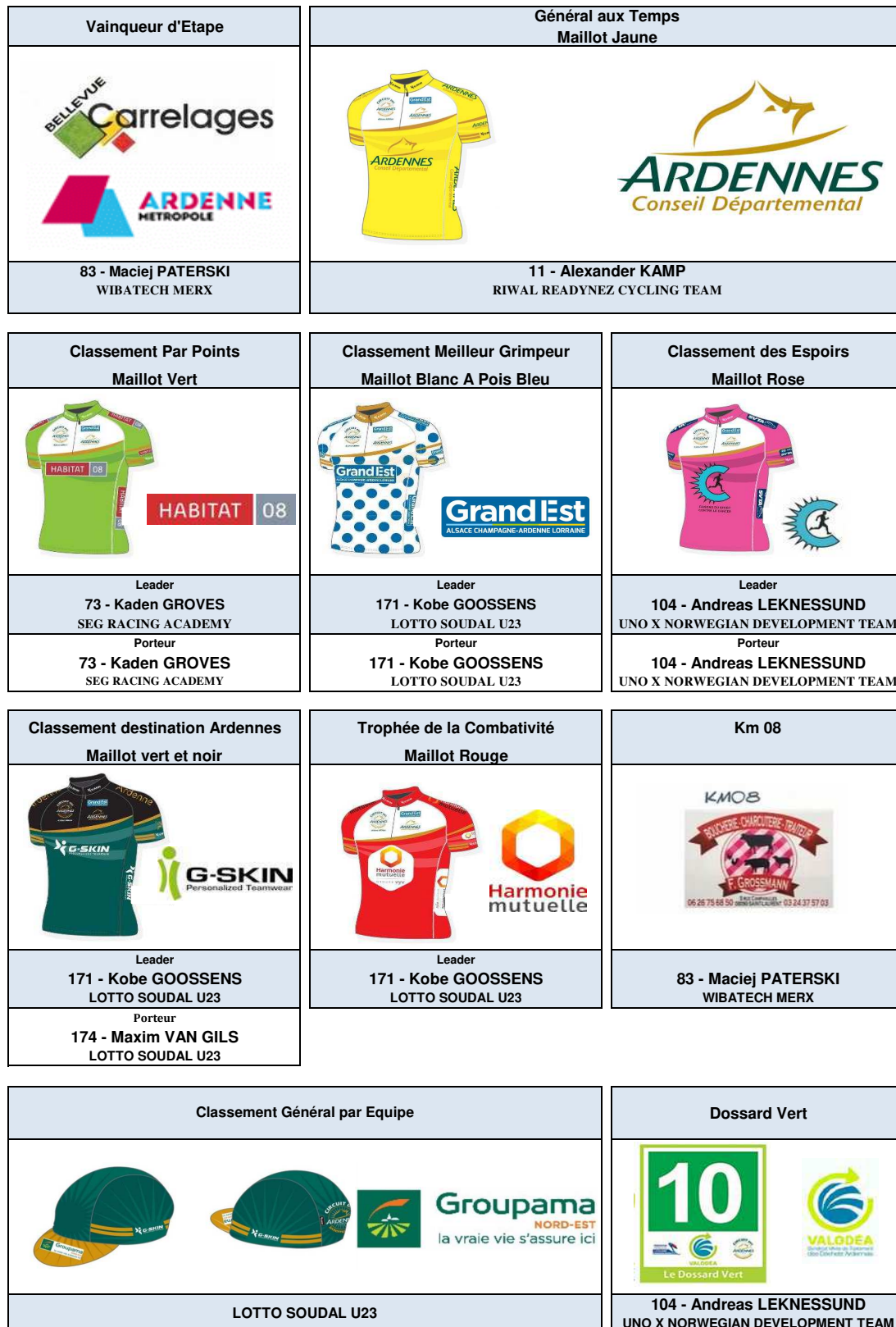
Tableau d'honneur après 3ème étape Nouvion sur Meuse - Aiglemont - Ardenne Métropole