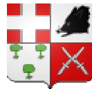
Sévigny la Forêt