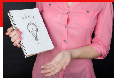
PLATE-FORME REVENDICATIVE DE LA CGT GROUPAMA