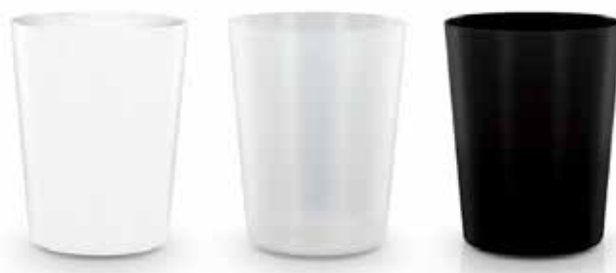
BLANC TRANSPARENT NOIR