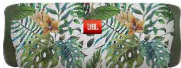
MARQUAGE MAX PRINT