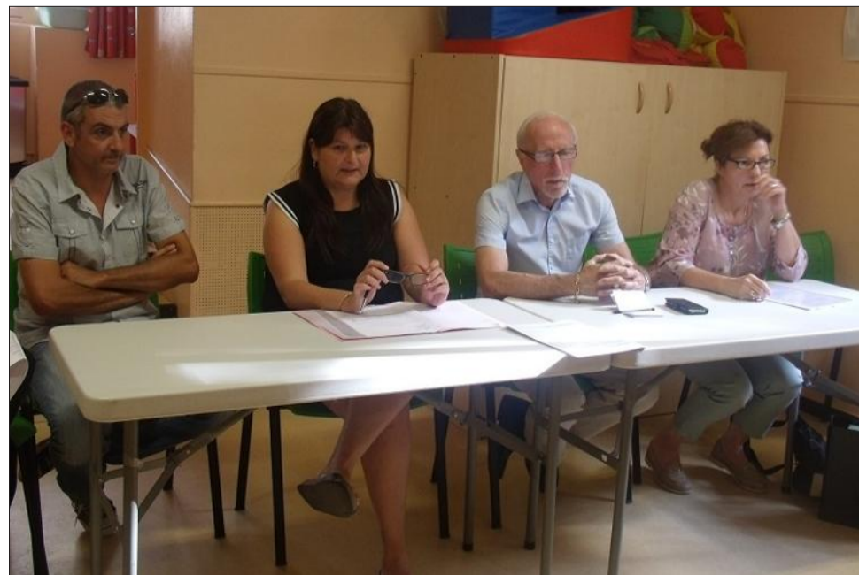
Le personnel de la crèche entouré du maire et des élus à la jeunesse et l'enfance.