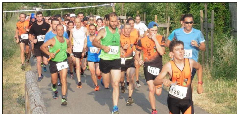
La course était organisée par la municipalité, en partenariat avec le Mistral Triath'Club d'Orange, au départ de l'ancienne gare.

La municipalité, en partenariat avec le Mistral Triath'Club d'Orange, organisait la 3 e Viafesta, course à pied autour de la Via-Ve-