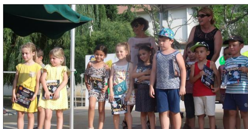
Les enfants étaient impatients de découvrir leur livre qui, cette année, a pour thème l'espace.