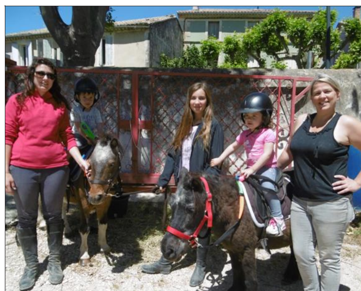
Convivialité, accueil chaleureux et bonne humeur au marché de printemps du Moulin d'Oli.