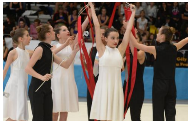
Baucoup de grâce et de prestance dans l'exécution des scènes.