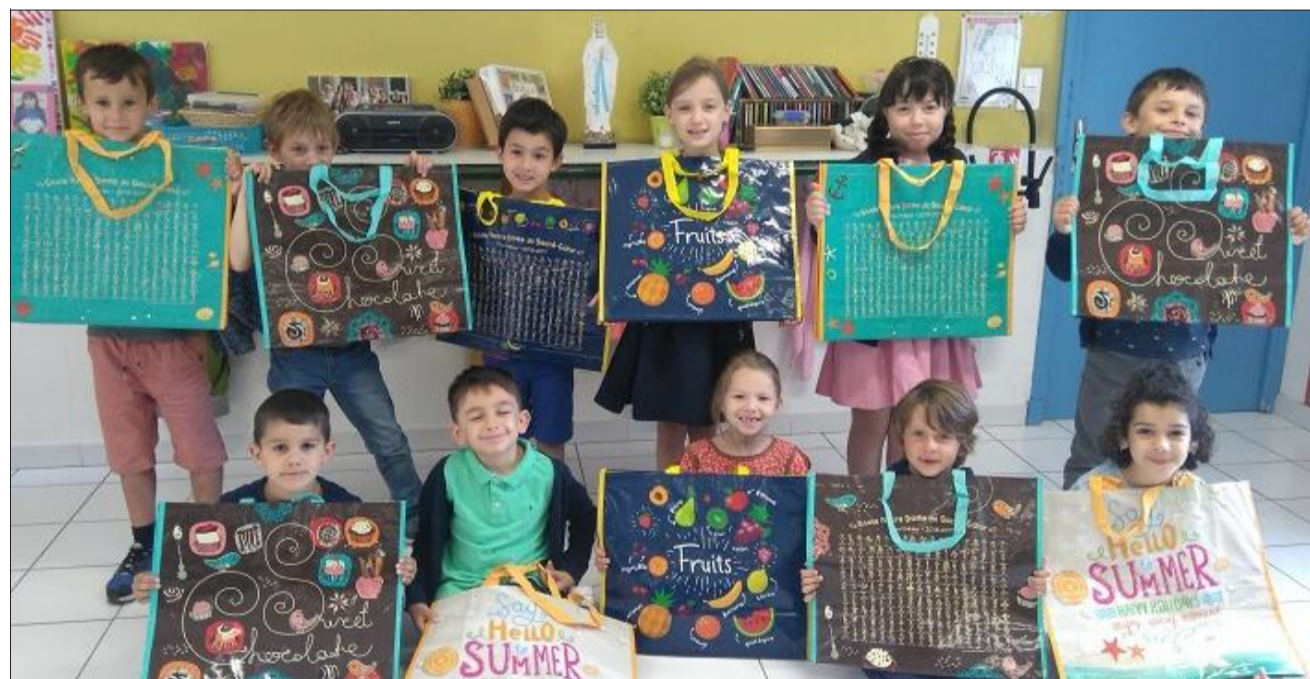
Des sacs hauts en couleur que les enfants seront fiers d'offrir aux mamans.

Pour la fête des mères, à l'école Notre-Dame les sacs sont de retour, après une première expérience réussie qui avait donné lieu à une autre création : les tabliers. L'association des parents d'élèves et de l'enseignement libre réserve chaque année un petit budget pour cela. Les bénéfices de cette action permettront de préparer la kermesse de fin d'année. À partir de supports créés avec les dessins des enfants, l'école a ensuite passé commande auprès d'une société qui travaille avec les écoles et associations. Au total, 180 cabas ont été distribués aux enfants, trois modèles ont été réalisés sur les thèmes chocolat, fruits et summer à l'effigie de l'école Notre-Dame. Des sacs colorés, originaux qui feront la fierté des mamans.