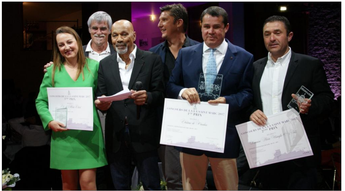
Les lauréats du Cep d'or pour le châteauneuf-du-pape blanc 2013.