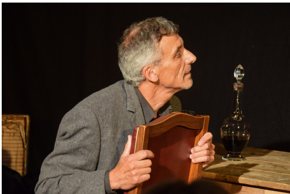
(...) Il y a de la griserie à observer son mécanisme (...)