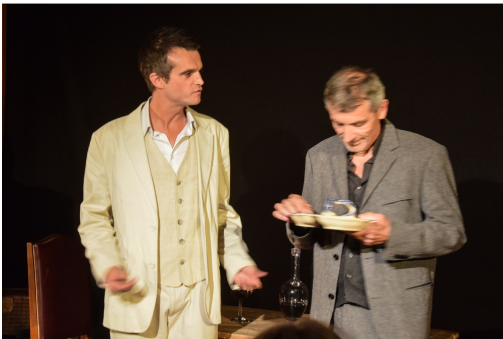
(...) je n'en reste pas moins surpris qu'un homme tel que vous n'est point trouvé son lieu (...)