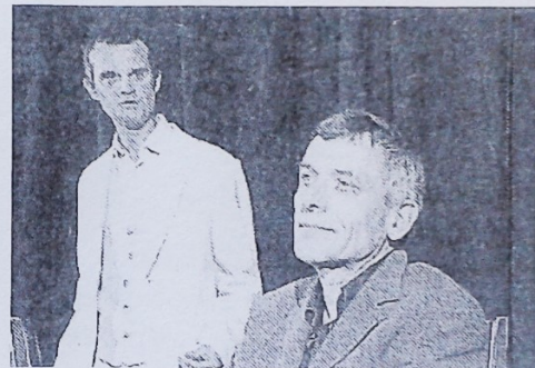
Pascal et Descartes s'affrontent.

Le public était au rendez-vous, attentif aux thèmes, qui entrent en ré-