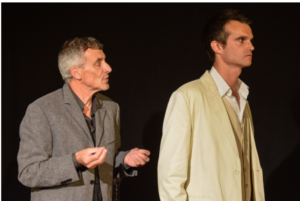
On ne peut parler ainsi, quand on a fait, comme vous l'avez fait, avancer les sciences à un âge (...)