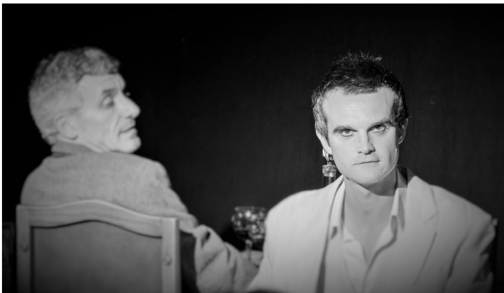
Mais vous êtes intraitable ?