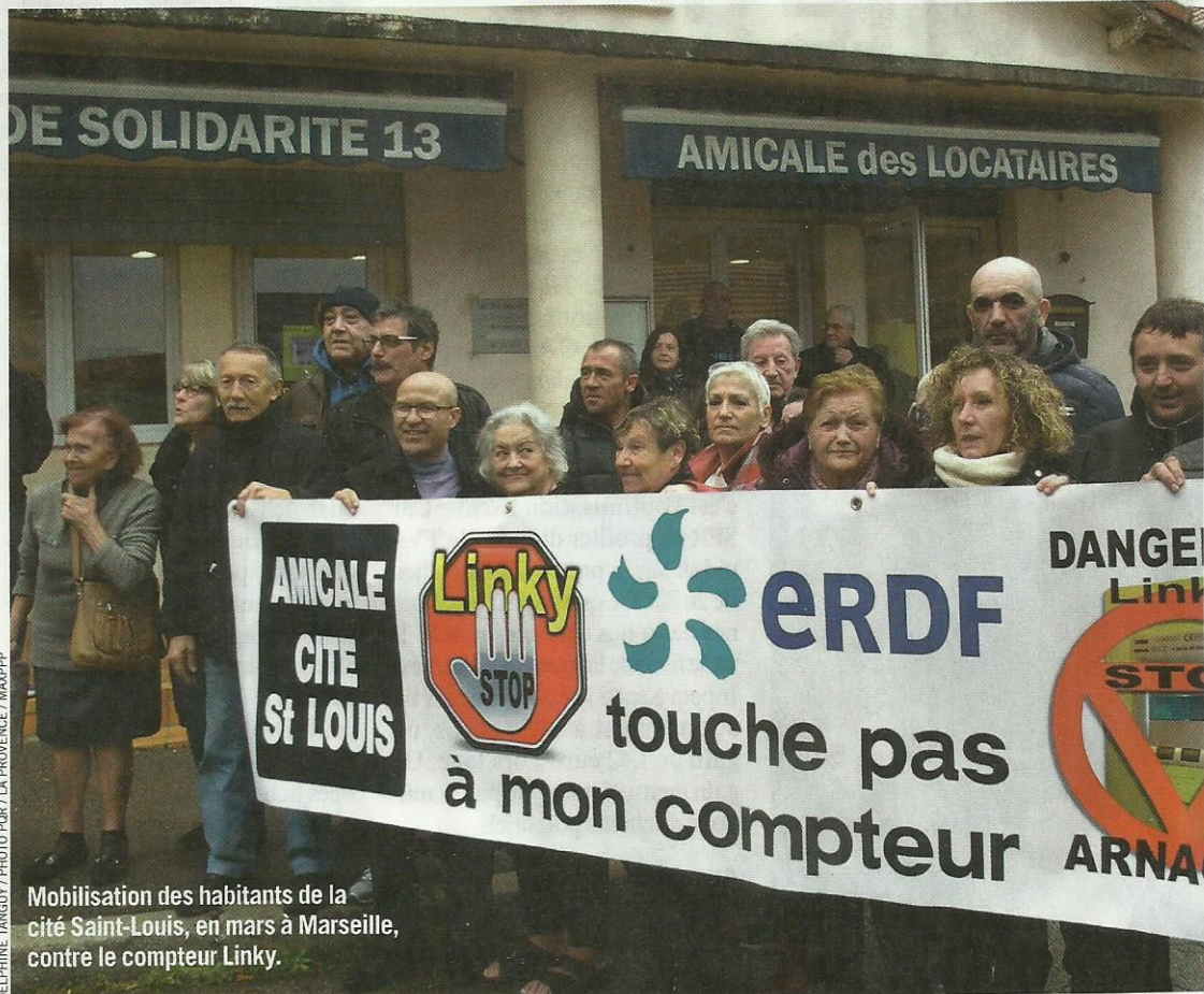
Mobilisation des habitants de la cité Saint-Louis, en mars à Marseille, contre le compteur Linky.