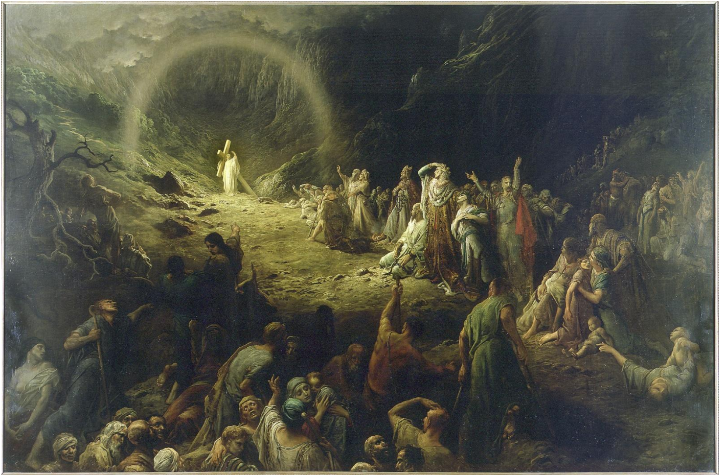
Gustave Doré, la Vallée de Larmes, huile sur toile, 1883.

Et enfin un tableau de plus de 4 mètres sur 6 (il faut quand même se représenter cette taille) qui m'a ému d'allégresse aux larmes (cette œuvre porte alors bien son nom). Il me fut très difficile de m'arracher à cette contemplation :