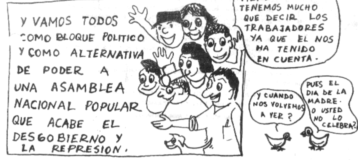
DE LOS TRABAJADORES Y DEL PUEBLO POR LA PAZ Y LA DEMOCRACIA.