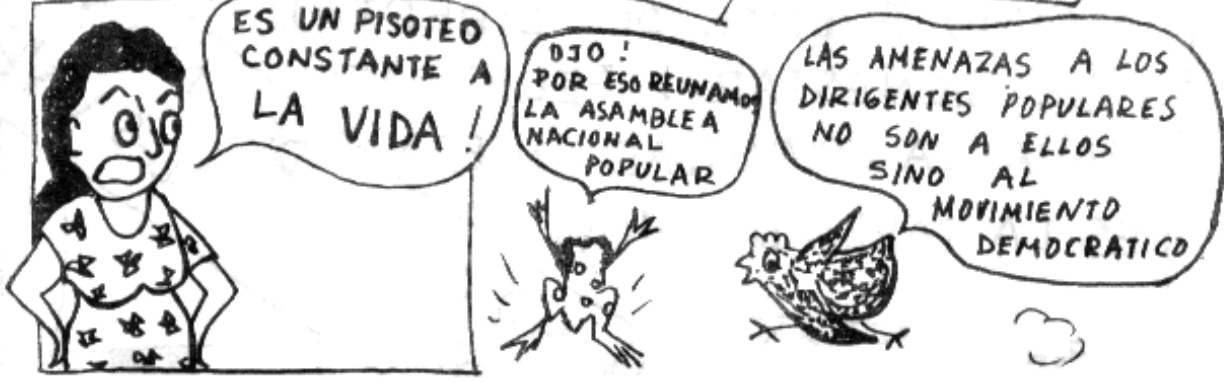
ANDRES ALMARALES VIVE Y ESTA PRESENTE EN LAS LUCHAS

NO HAY EMPLEO PARA LOS OBREROS NO HAY TIERRA PARA LOS CAMPESINOS NO HAY CUPOS PARA LOS ESTUDIANTES NO HAY CAMAS PARA LOS ENFERMOS NO HAY SERVICIOS PUBLICOS PARA EL PUEBLO PERO SI HAY REPRESION PARA TODOS.