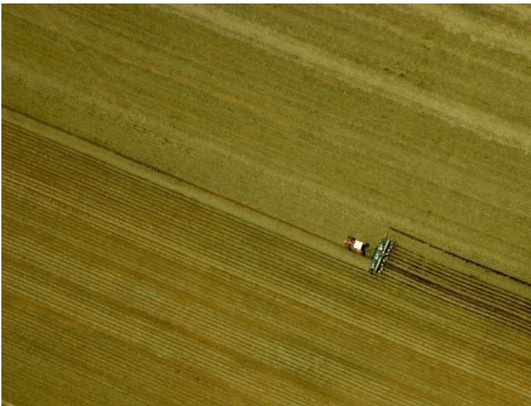
3. Monoculture, le rouleau compresseur de la civilisation