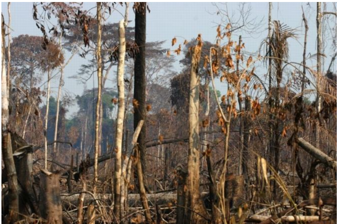
2. Une forêt dévastée