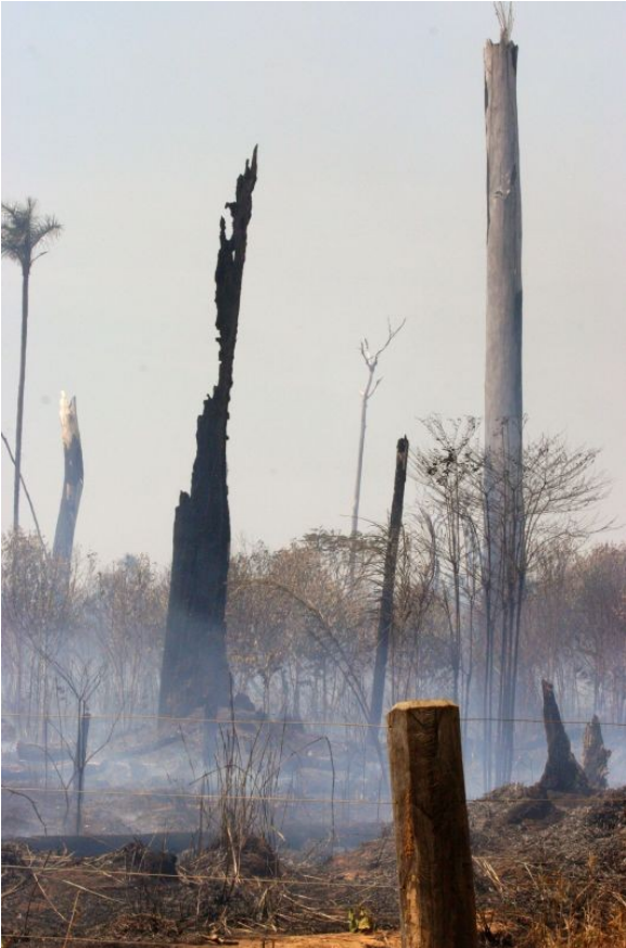
3. Des arbres de 40 m calcinés sur pied