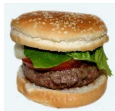
4. Votre hamburger est servi

Hors élevage, l'agriculture est responsable d'environ 30% de la déforestation de l'Amazonie brésilienne. Le soja en est le principal vecteur.