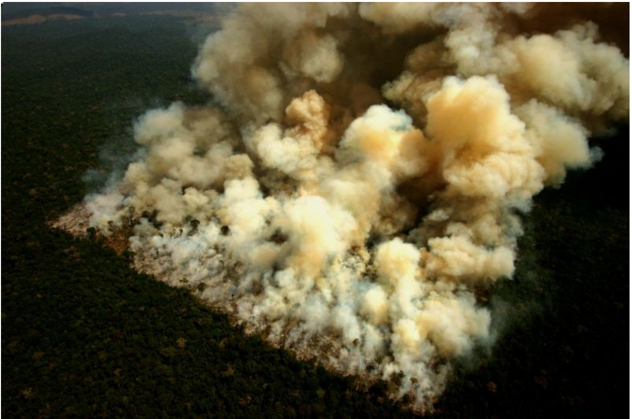
1. Incendie volontaire