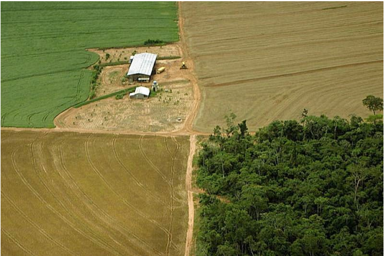
2. Implantation agricole dans la forêt d'émeraude