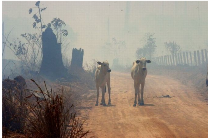
4. Prochaines victimes de notre voracité

Le parcage du bétail est la cause de 65% de la destruction de la forêt amazonienne au Brésil