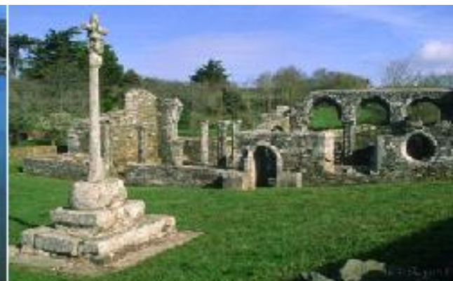
Les ruines de Languidou, Plovan