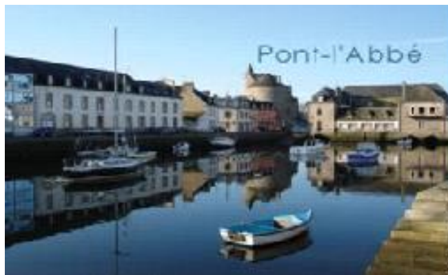
La rivière de Pont l'Abbé