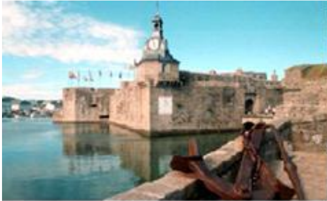
La Ville Close, Concarneau