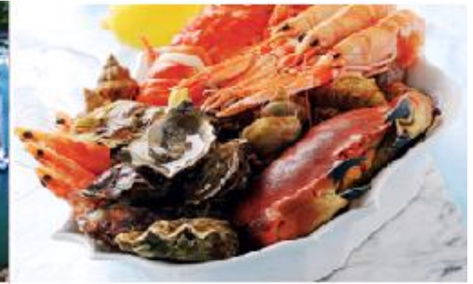
Plateau de fruits de mer