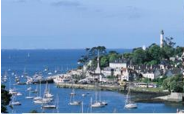
Le port de Bénodet