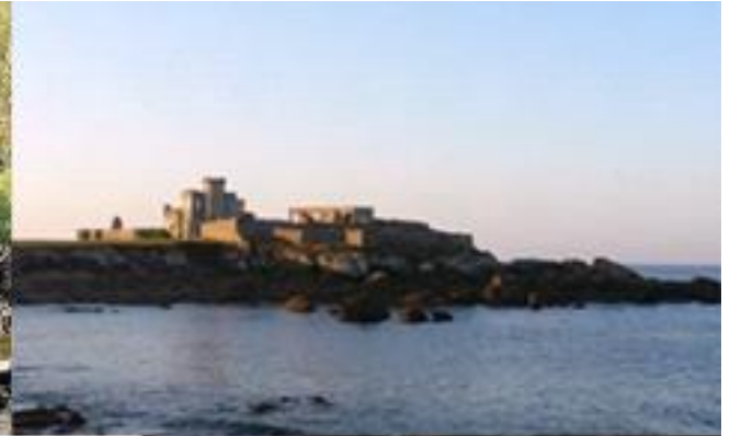
Le fort de Trévignon, Trégunc