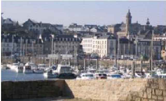
Le port d'Audierne