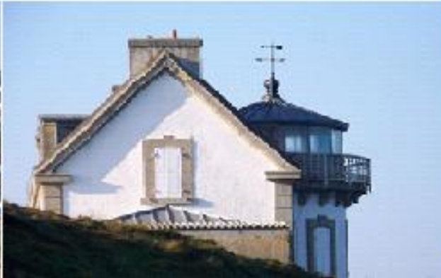
La Maison-Phare du Millier, Beuzec