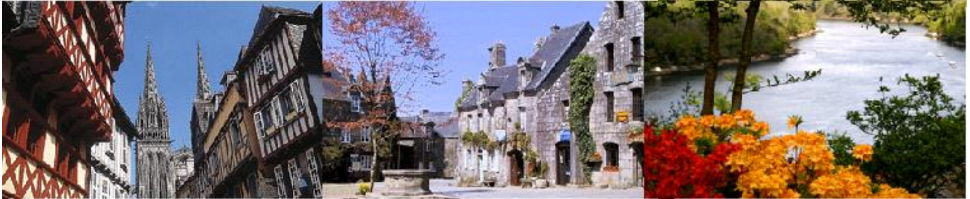
Le centre-ville de Quimper