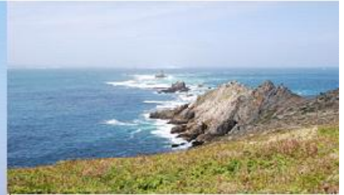
La Pointe du Raz, Plogoff