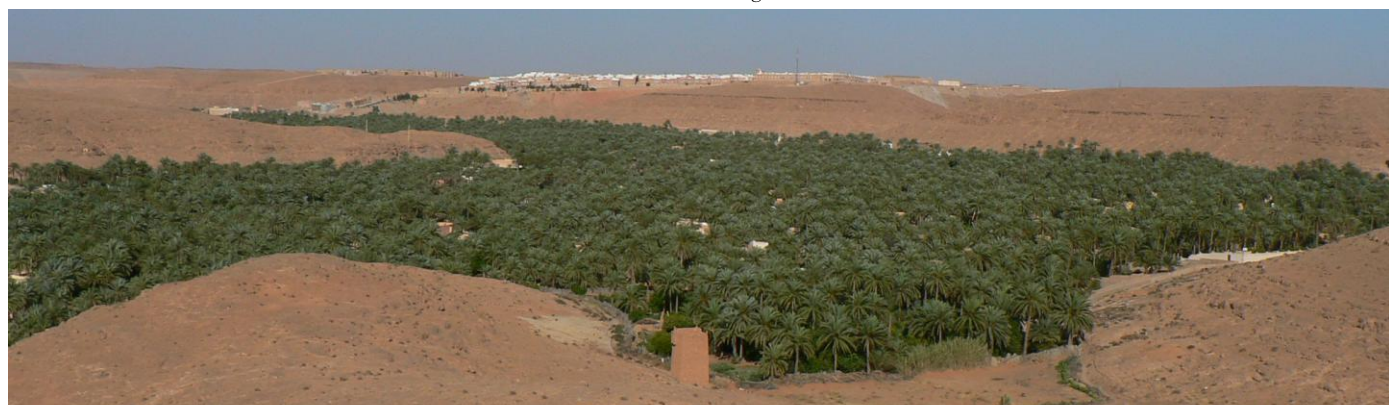
Oasis de Beni Isguen