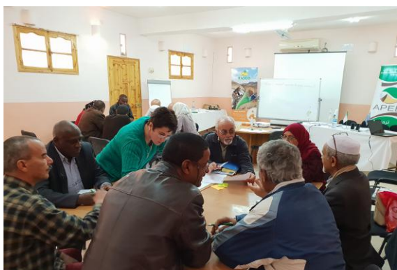
Deuxième rencontre annuelle du projet DevOasis et mise en place d'une feuille de route de sortie de programme

La rencontre a regroupé une vingtaine de participants (administrations locales, collectivités locales, universités et associations). Les participants sont venus de plusieurs wilayas du pays : Laghouat, Ghardaïa, Ouargla, Béchar, Timimoune et Illizi.