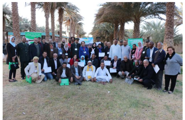
Participants à l'atelier national pour un état des lieux des oasis du sud algérien et leur programme de sauvegarde

- Diffusion des informations sur les oasis dans les différentes radios locales.