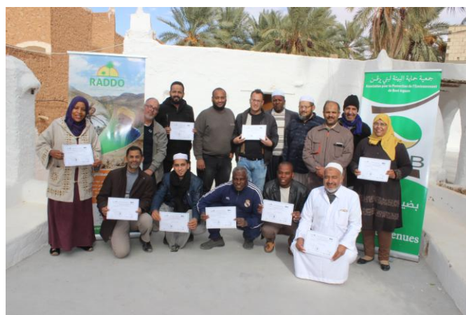
Remise des attestations aux participants à la formation technique sur le compostage