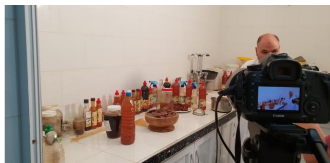
Tournage du film sur les bonnes pratiques oasiennes (Robbah - El Oued)

Le second film réalisé à Laghouat met en valeur l'usage du sel comme traitement naturel pour les maladies du palmier. Le sel est peu coûteux (disponible et accessible aux agriculteurs) et permet de lutter efficacement contre certains insectes et champignons sans perturber la nature.