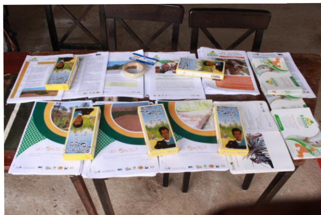
Stand d'exposition du projet DevOasis