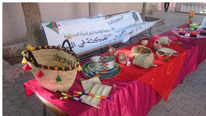
Exposition de produits valorisés par l'association Trésor de la femme saharienne