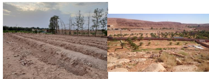
Aménagement de l'unité phoenicicole à Beni Isguen et à Laghouat

À Beni Isguen comme à Laghouat, il y a eu l'acquisition de deux broyeurs de végétaux (palmes) pour l'aménagement d'unités phoenicicoles. Bien que l'aménagement des unités phoenicicoles a pris du retard, les travaux sont bien entamés.