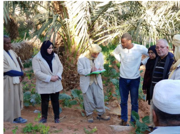
Voyage d'études et de partage d'expériences (Haaj Guelmane - Timimoune)