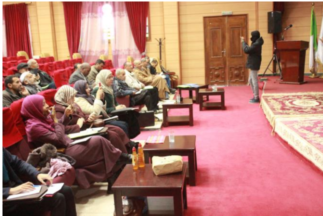
Participants à la formation en permaculture