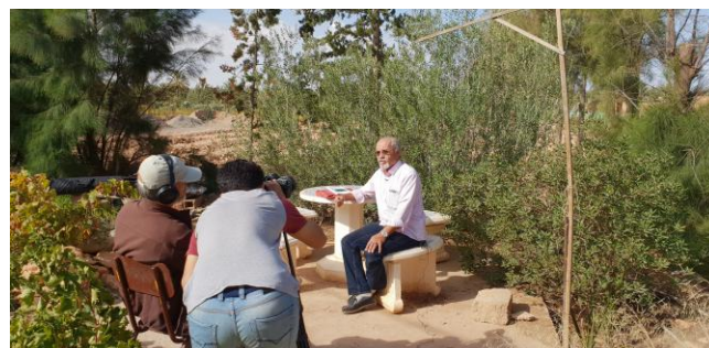
Tournage du film sur les bonnes pratiques oasiennes (Laghouat)

Revaloriser les produits déclassés : transformation des dattes en vinaigre