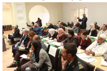
Participants à l'atelier national pour un état des lieux des oasis du sud algérien et leur programme de sauvegarde (en plénière)