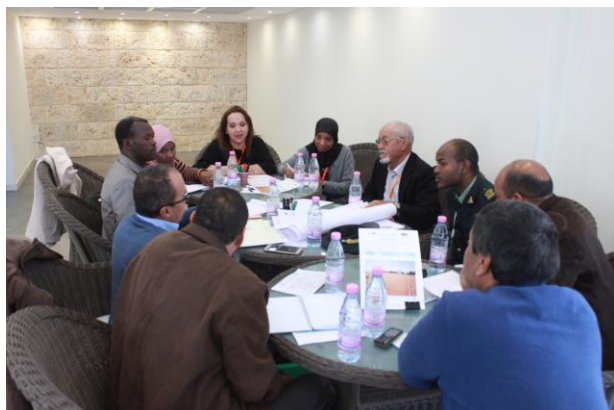
World-Café à l'atelier national

Lien : http://www.apeb-dz.org/atelier-national-du-projet-devoasis-2/