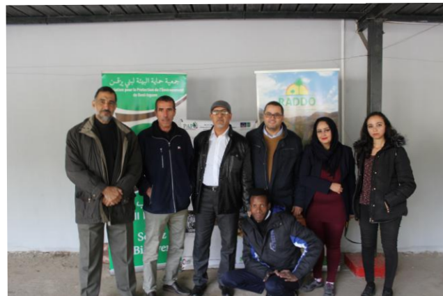
Associations partenaires du projet DevOasis et équipe de l'antenne du PAP-ENPARD Laghouat au séminaire de capitalisation