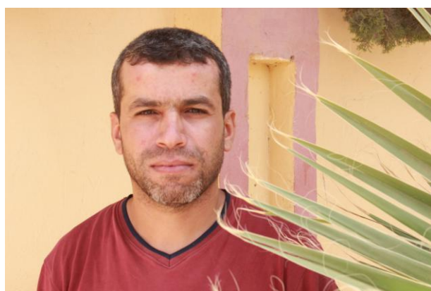
Président du groupement N'Tissa

C'est une association agricole créée en 2002 portant le nom d'Oued Intissa irriguant le périmètre agricole de Béni-Isguen (Ghardaïa). Ses domaines d'intervention sont la promotion de la zone agricole « INTISSA » sur les plans économiques et techniques. L'association encadre des campagnes de sensibilisation pour l'agriculture et gère des puits d'irrigation dans le périmètre agricole.