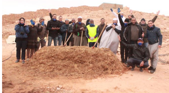
Participants à la formation technique sur le compostage

La première journée de formation a été consacrée à la partie théorique sur le compostage et la deuxième journée à la pratique. Cette dernière a permis de faire le trempage des déchets de l'oasis, l'installation d'un andin, l'incorporation du fumier ovin et l'arrosage. Il y a eu également une confrontation des expériences et des témoignages des oasiens tout au long de la journée.