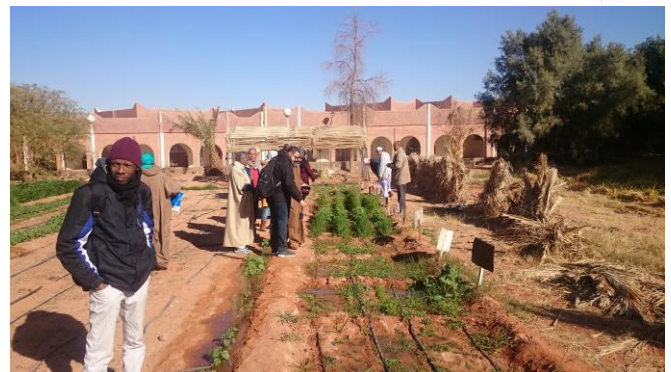
Voyage d'études et de partage d'expériences (ITMAS de Timimoune)

Ce voyage plein de découvertes a contribué au renforcement des capacités des associations sur le fonctionnement de l'agrosystème oasien, la filière dattes, la valorisation des productions oasiennes, l'artisanat et l'écotourisme dans les régions du Touat et du Gourara. Ce second voyage national du projet a permis aussi d'accompagner les réflexions des acteurs sur les filières des produits oasiens avec un focus sur la valorisation des dattes et l'écotourisme grâce à la découverte de plusieurs types d'oasis dans la région: (i) Les oasis en bordure ouest du plateau du Tadmaït et celles en lisière sud du Grand Erg Occidental, les plus anciennes, sont irriguées par la foggara qui tire son eau du Continental Intercalaire. (ii) Les oasis au milieu des dunes de l'erg (Taghouzi à l'ouest de Timimoune et Tinerkouk au nord), plus récentes, où la nappe phréatique est très proche de la surface du sol, quant à elles, sont équipées de puits à balanciers, remplacés aujourd'hui par des électropompes. (iii) La petite mise en valeur agricole (moins de 5 ha), issue de l'application de la loi APFA de 1983, attribuée à la main-d'œuvre servile héritée du passé (Les harratines). (iv) Les grands périmètres de mise en valeur agricole, caractérisés par de grands périmètres irrigués par rampes-pivots, le travail mécanisé et l'emploi salarié ont été attribués entre autres aux grandes familles locales pour compenser leur déclin économique suite à la perte de cette main d'œuvre servile (les harratines).