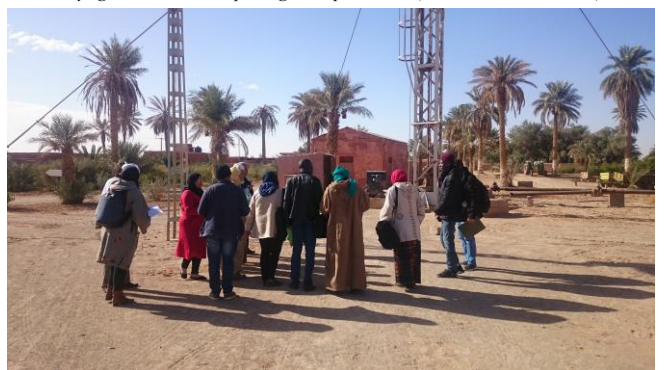
Voyage d'études et de partage d'expériences (INRAA Adrar)