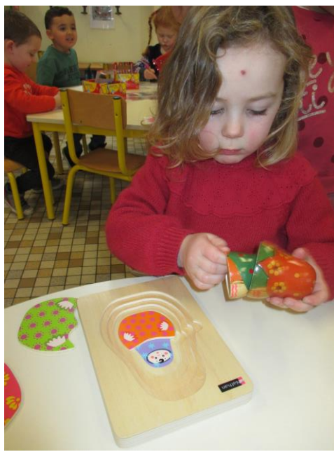
J'apprends aussi en manipulant les « activités-tiroirs » : l'ordre des grandeurs avec les Matriochkas.