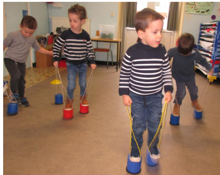
Les échasses : je suis plus à l'aise sur les échasses. Je me déplace de plus en plus vite. Nous organisons des courses !