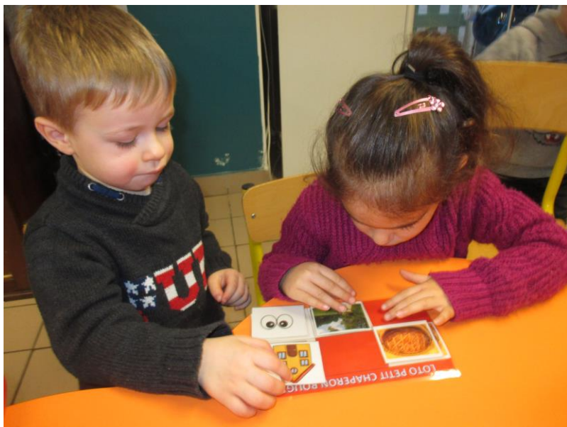
Je joue au loto du Petit Chaperon rouge.