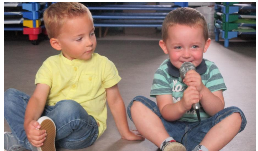
Je me présente en disant mon prénom dans le micro.