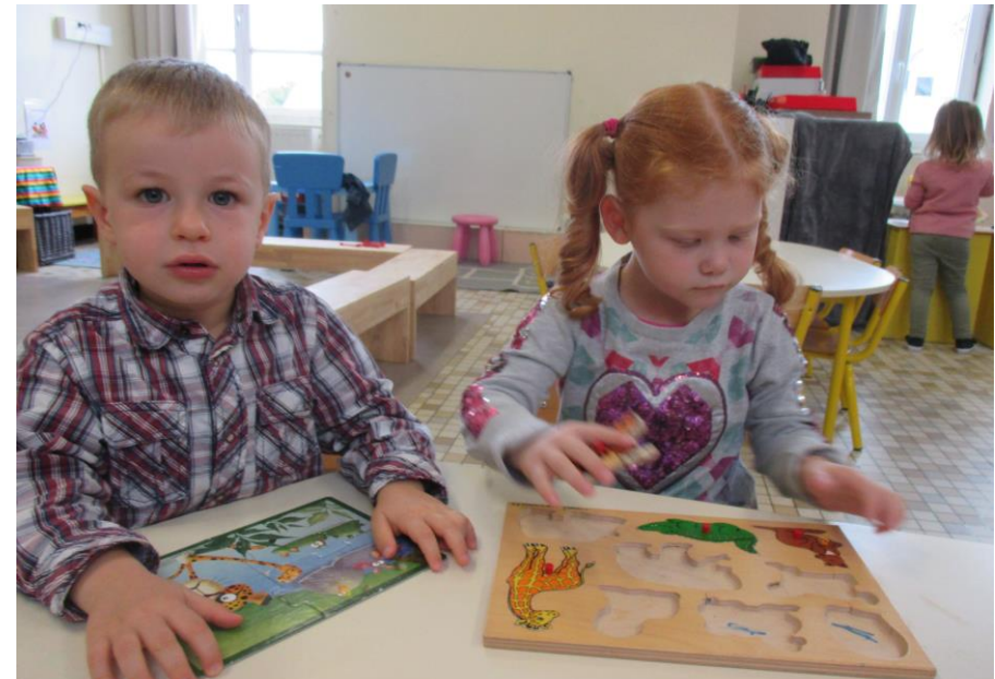
Je fais des encastrements et/ou des puzzles.