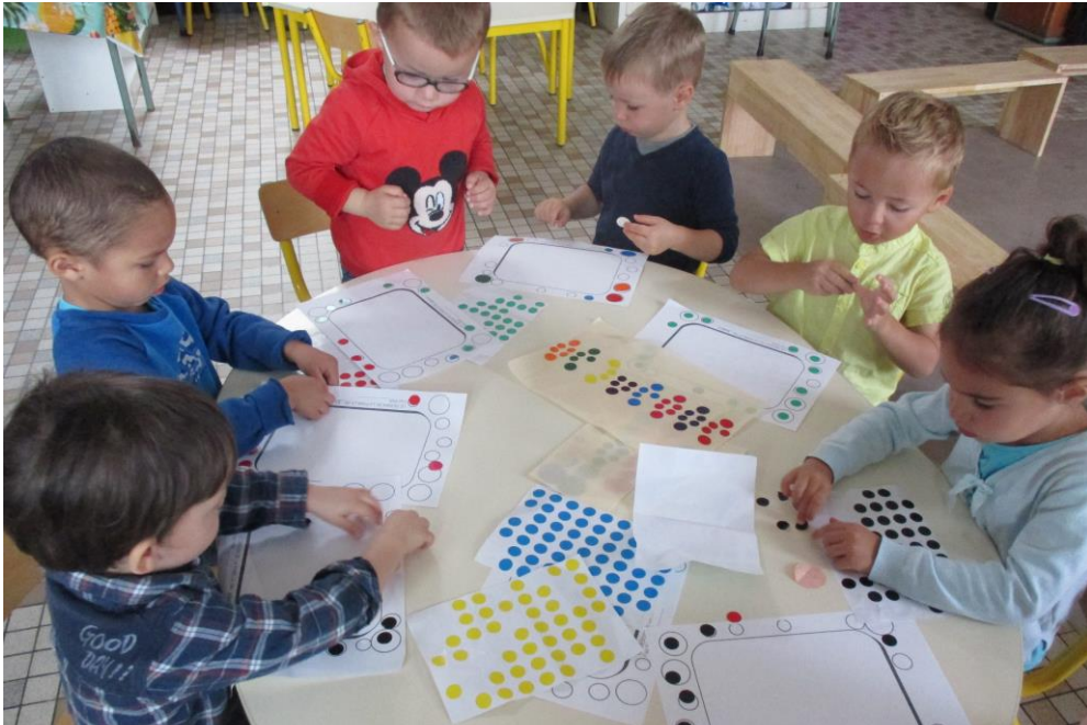
Je colle des gommettes dans les bulles.