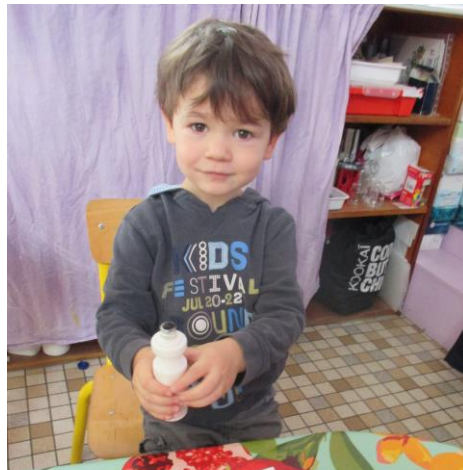
Je fais preuve de création en décorant mon étiquette-présence.