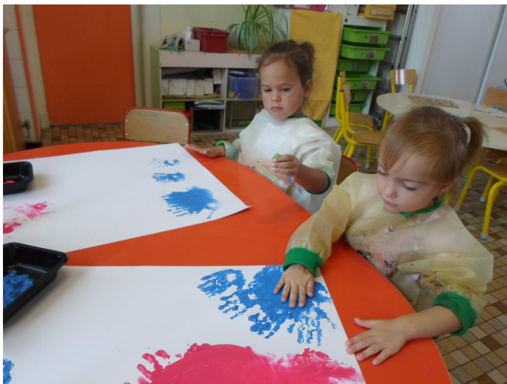
Atelier 2 : Nous laissons des traces, en peignant avec nos mains.