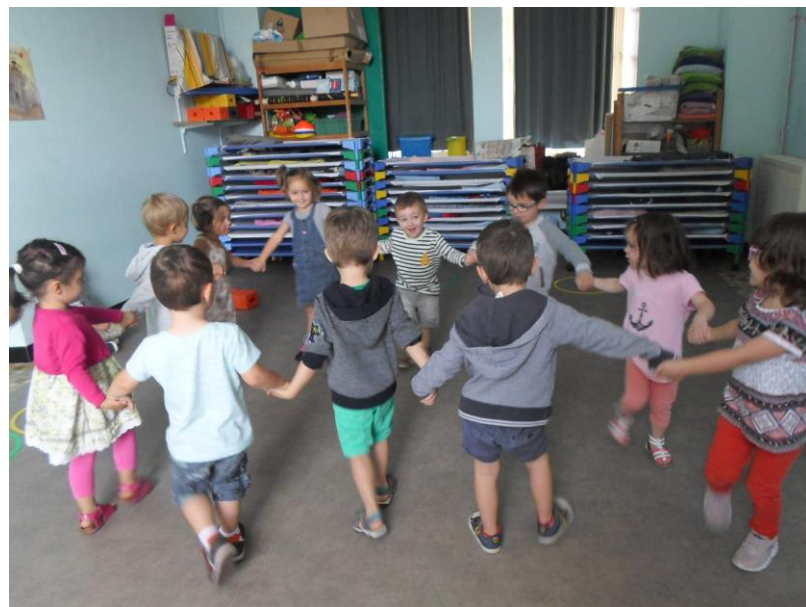
La ronde des prénoms