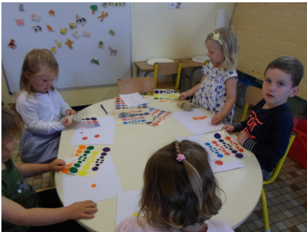
Atelier 1 : Nous collons librement des gommettes.