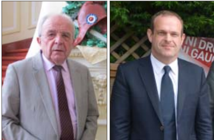
Le 30 mars, cela pourrait se jouer dans un mouchoir de poche entre Eugène Binaisse et Steeve Briois.

Un chiffre record pour le FN puisque jusqu'alors jamais atteint, à Hénin, en termes de sondages.