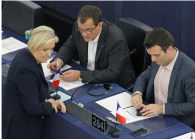
Marine Le Pen, Louis Aliot et Florian Philippot au Parlement européen, le 15 décembre 2015.

employées pour rétribuer [Louis Aliot] peuvent être considérées comme éthiquement discutables, elles ne sont pas attaques légalement car la collecte des preuves contraires est impossible compte tenu de l'état des textes existants sur le statuts des [assistants locaux] ».