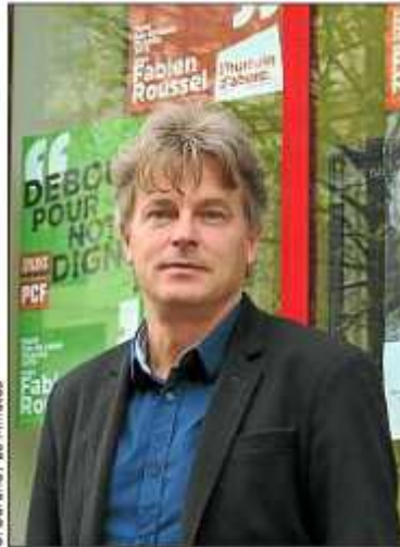
Le communiste Fabien Roussel.

Nous avons choisi « L'humain d'abord » comme slogan. Nous voulons montrer combien la politique d'austérité fait mal, alors que les richesses existent pour répondre aux besoins de la population.