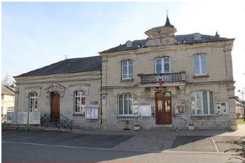
RESSONS SUR MATZ - LA MAIRIE