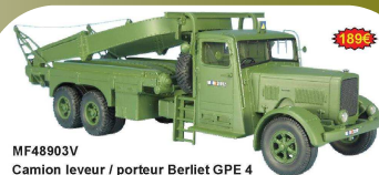
MF48903V Camion leveur / porteur Berliet GPE 4

Vous l'aurez compris, cette miniature est un vrai coup de cœur, une des plus réussies de la gamme ! Disponible en « monté et peint » (réf. : MF48903V - 189 €) ou en kit (réf. : MF48903K - 92 €*).