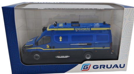
Iveco Daily VMG diffusé par Gruau avec boîtage

A noter qu'il a aussi été distribué par Gruau, avec un boîtage spécial.