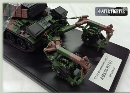
L'AMX3 B2 DT Brennus tel que celui-ci sera proposé par Master Fighter en avril...

L'absence de décals qui pourra, espérons-le, être corrigée par l'édition prochaine d'une planche de décals spécifique. En ce qui concerne les rouleaux URBAN et leur ensemble porteur peints en vert uniforme sur les premières photos publiées sur Milinfo, la remarque n'a plus lieu d'être puisque sur le modèle qui sera commercialisé en avril, les rouleaux et leur ensemble porteur sont bien peints en livrée 3 tons Centre-Europe, comme le reste du char.