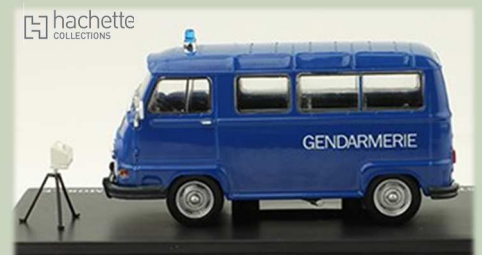
Estafette 800 Minicar type R 2136 A - Collection Utilitaires Renault - n° 11 - Echelle 1/43 - 15,99 €

Quand apparaît l'Estafette, en 1959, la Gendarmerie se montre intéressée mais son moteur est jugé trop peu puissant. Renault parvient néanmoins à en vendre quelques exemplaires de type R2130, notamment pour les missions de secours routier. En 1962, l'adoption du nouveau quatre cylindres Sierra de la Renault 8 séduit la Gendarmerie. L'Estafette, ou plutôt l'Alouette, la version mixte transports de personnes/transports de marchandises avec les sièges démontables, est adoptée... la plupart du temps avec 6 sièges à l'arrière laissant de l'espace pour le transport de matériels, dont les premiers radars. Livrée en quantité croissante, elle va rapidement devenir quasi hégémonique... Il faut dire qu'elle n'a guère de concurrence puisqu'elle est plus grosse que les divers break dont l'arme s'est dotée (204, 304, 504,