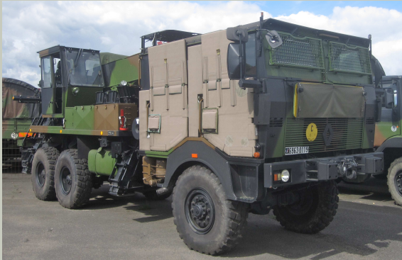
TRM 10 000 CLD stationné dans le parc du 8 ème RMAT de Satory où il a reçu un surblindage « peau de requin » sur les faces latérales de la cabine et des grilles sur le parebrise avant son départ en OPEX.