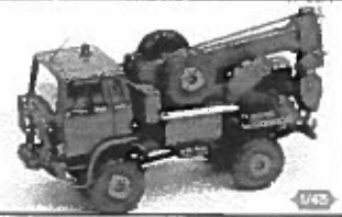
Le TRM 2000 dépannage

Un TRM 10000 de dépannage devrait faire son apparition dans la gamme Replex d'ici la fin de l'année (voir photo). Il sera commercialisé dans la livrée 3 tons de l'Otan.