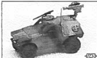
VBL Panhard Milan

A vous de voir si ce «bijou blindé» vaut un investissement de plus de 400 frs ! Lire en dernière page à ce sujet les précisions apportées par le service commercial de CEF.