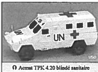
Acmat TPK 4.20 blindé sanitaire

Difficile voire même impossible de présenter ici toutes les versions. Pour