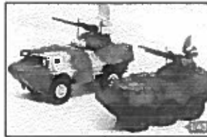
VAB 4x4 et 6x6 équipés de la tourelle bi-tube Dassault (Réf. 262 et 265)

tionneurs, la reproduction à l'échelle 1/50 ne sera pas disponible avant la fin de l'année si aucun nouveau retard n'intervient. D'ici là, il faudra vous armer de patience !