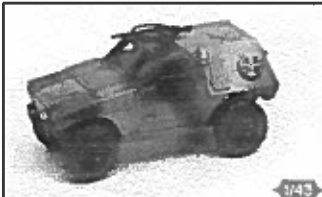
VBL Panhard reconnaissance 7,62 mm