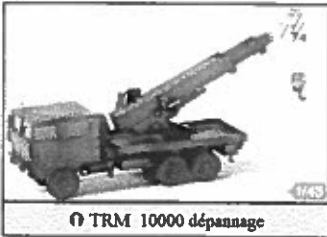
Le TRM 10000 dépannage

Durant des années, le camion-cargo couramment utilisé dans l'armée de