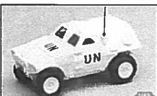
VBL Panhard VTT «UN»

Panhard et Renault sont mis en concurrence et c'est finalement le prototype de Panhard qui est retenu.