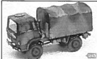
Le TRM 2000 camouflage 3 tons OTAN

Digne successeur du Marmon et autres camions tactiques, le TRM 2000 reprend le concept de gamme intégrée qui s'appuie sur la diminution des coûts d'acquisition et d'entretien en développant un véhicule qui trouve son origine dans la gamme civile du constructeur.