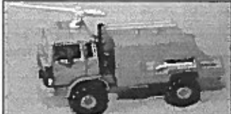
Le TRM 2000 avec lance incendie

L'accès aux plans techniques permet une réduction précise avec tous les détails qui font de chaque modèle une reproduction fidèle. Le TRM 2000 Cef-Replex est vendu entre 300 et 400 frs selon les versions. Il existe aussi en version dépannage (non retenue par l'armée française), incendie et gendarmerie. Pour cette dernière version, nous émettons quelques doutes sur la couleur : en effet si la Gendarmerie utilise des TRM 2000 depuis 1987, à notre connaissance, ceux-ci ne sont pas peints en bleu mais en vert armée (voir commentaire à ce sujet en dernière page). A noter également l'apparition récente d'un fourgon radiophotographique de la gendarmerie dont l'existence ne fait aucun doute puisque nous avons pu trouver une photo du modèle à l'échelle 1. Les versions avec cabine bâchée torpédo présentées dans les anciens catalogues Cef-Replex n'ont jamais été commercialisées. C'est d'ailleurs également le cas de la Peugeot P 4.