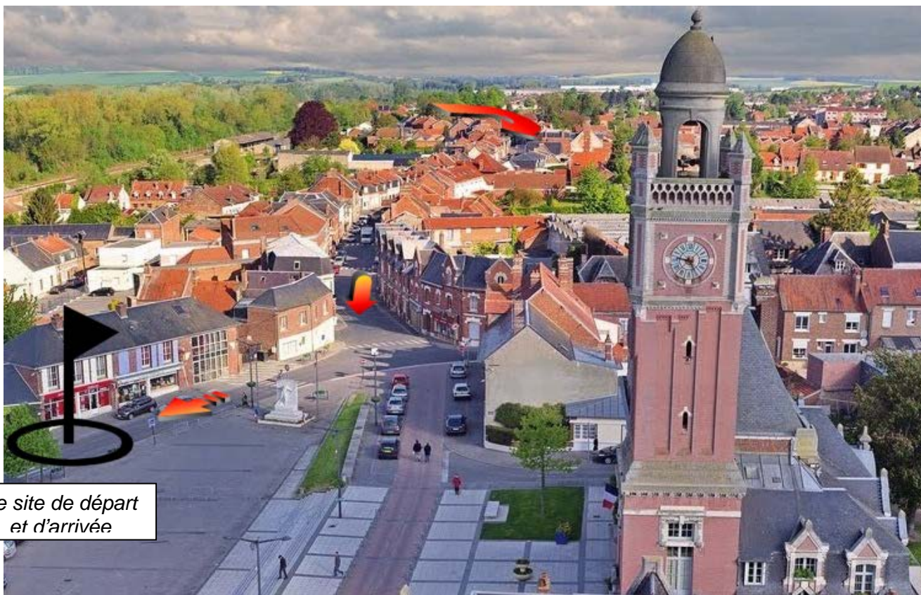
Le site de départ et d'arrivée