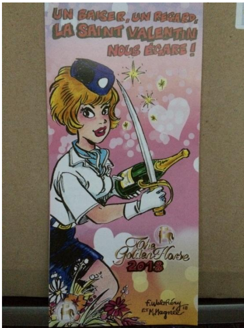
Pub Golden Horse