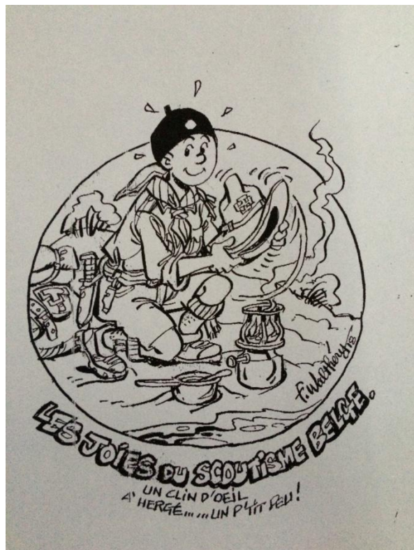
Dessin pour les ADH