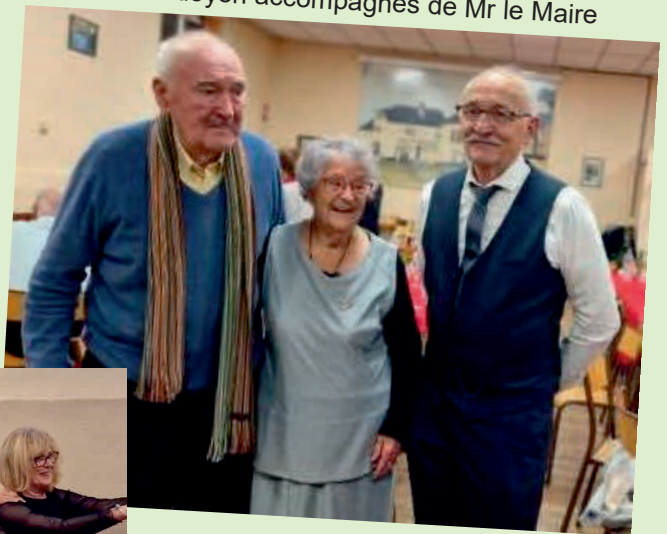
Doyenne et doyen accompagnés de Mr le Maire