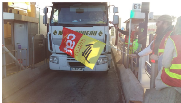
Action au péage dans une bonne ambiance