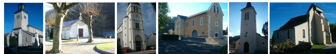
St Michel - ND de la Vallée Heureuse Gelos