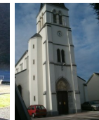
St Jacques Uzos