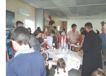
1ère communion - Fête paroissiale