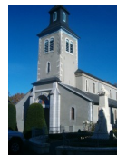
St Michel - ND de la Vallée Heureuse Gelos