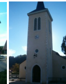
St Ambroise Narcastet