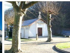
St Barthélémy Mazères