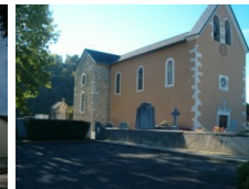
St Pierre Rontignon