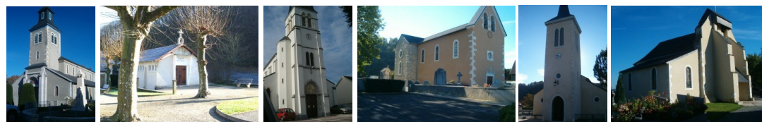
St Michel - ND de la Vallée Heureuse Gelos