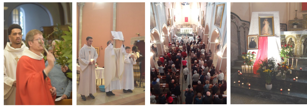
Rameaux - Jeudi Saint - Pâques - Dimanche de la Divine Miséricorde