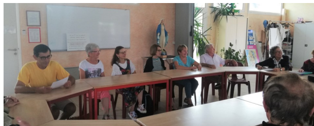
7 septembre : Rencontre des distributeurs du Lien