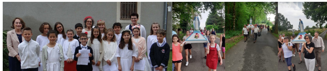
5 juin : Confirmation et 1ère Communion