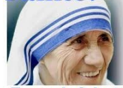
Teresa de Calcutta