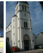
St Jacques Uzos