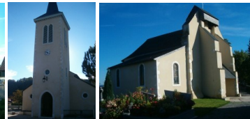
St Ambroise Narcastet