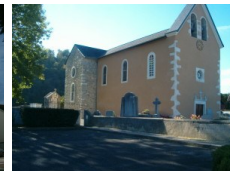
St Pierre Rontignon