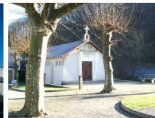
St Barthélémy Mazères