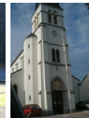
St Jacques Uzos