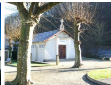
St Barthélémy Mazères