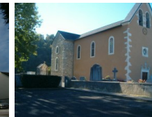
St Pierre Rontignon