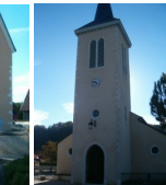
St Ambroise Narcastet