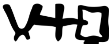
Crèche Croix Tabernacle