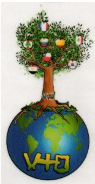
L'arbre du Prado