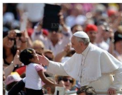
La joie de l'évangile