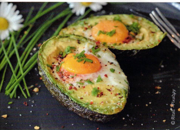
Réhabilitons les bonnes graisses.