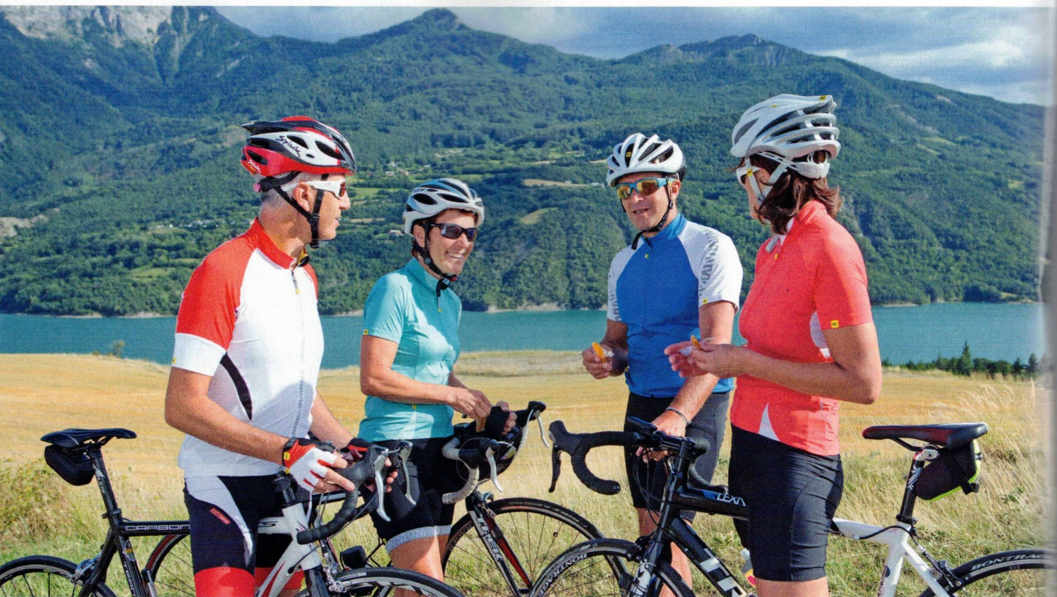
Activité physique, nutrition adaptée et vie sociale harmonieuse sont les trois piliers d'une santé active.