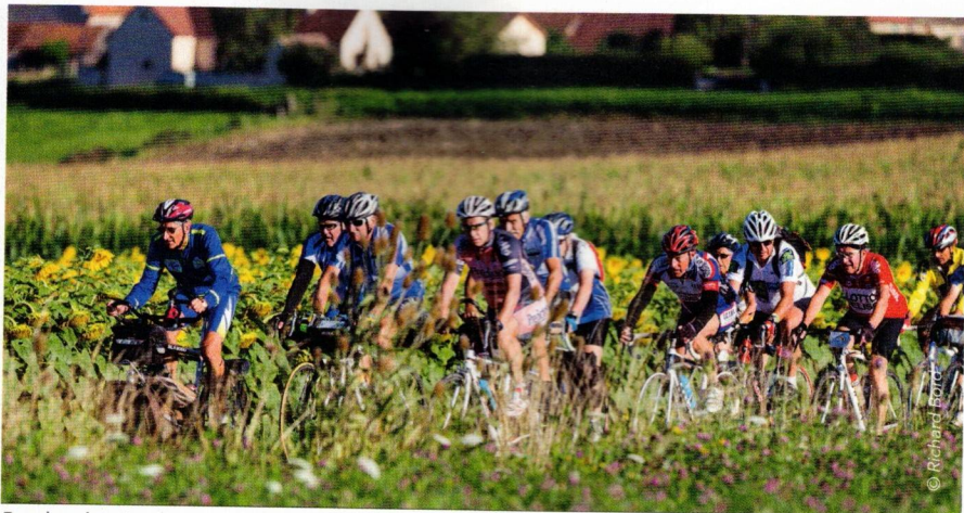
Pendant les vingt premiers kilomètres on roule ensemble avec comme repère l'allure du « maillon faible ».