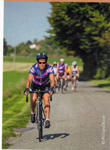
Dans un groupe on observe toujours des comportements plus individualistes avec une propension à la compétition, aux défis personnels...

être une sortie club sereine et bénéfique pour la santé. Pas le temps de se mettre en route par une activation progressive de notre organisme et pas de retour au calme dans le dernier quart d'heure. Moyenne oblige ! Et que faire d'un maillon faible lors de cette « cyclosportive » hebdomadaire ? Pour ceux qui tiennent absolument à se référer à une vitesse moyenne, il est possible de prendre le temps de s'échauffer et d'arrêter le chrono quelques kilomètres avant de descendre de selle.