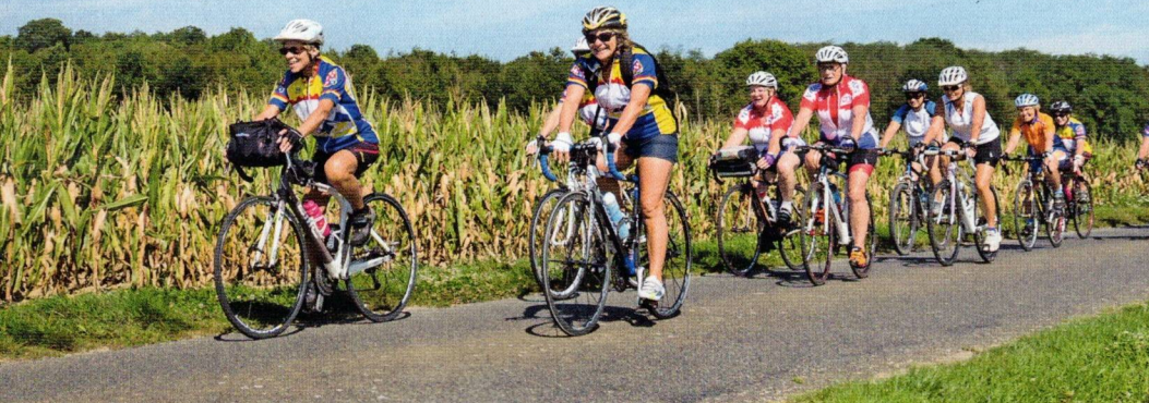
Tout le monde se regroupe pour faire redescendre la ventilation, pour un retour au calme, avant la pause hydratation de fin de parcours.

Retrouvez un article sur la même thématique, « La sortie du dimanche », dans la revue Cyclotourisme de janvier 2023 (n° 730).