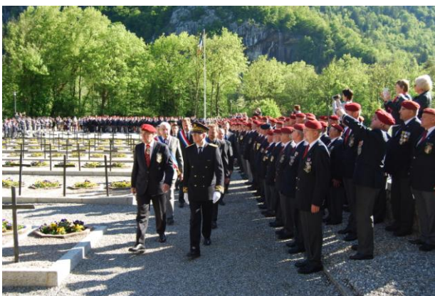
800 paras rassemblés