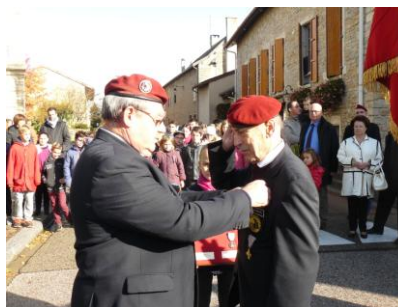
Commemorative de Suez

PARAS D'AIN , bulletin de liaison des membres de la section UNP AIN-BUGEY.