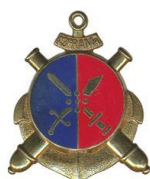
43 ème RAMa de réserve