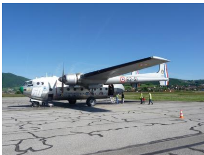
Le dernier Nord (N° 105) qualifié pour voler