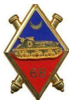
68 ème RAA