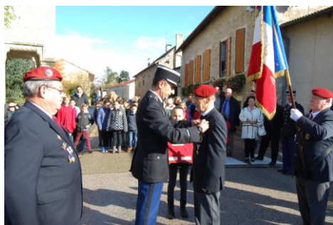
Titre de Reconnaissance de la Nation