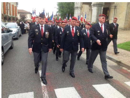
Préparation du défilé