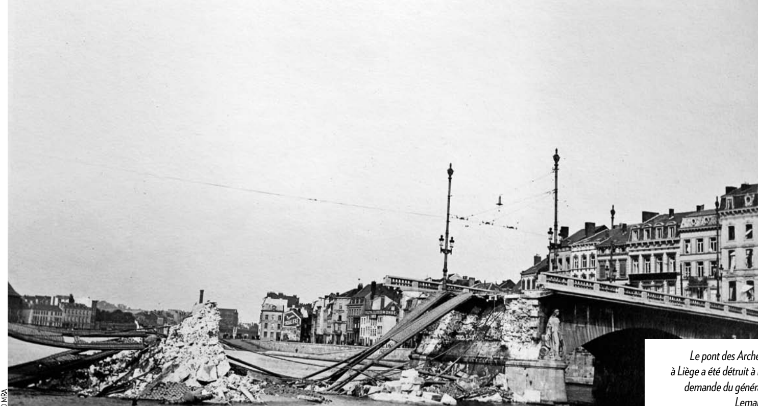
Le pont des Arches à Liège a été détruit à la demande du général Leman.

« Le Gouvernement belge est fermement décidé à repousser par tous les moyens en son pouvoir, toute atteinte à son droit... » affirmait la réponse à l'ultimatum allemand du 2 août. Alors que la guerre est maintenant inévitable, il sait que son armée ne dispose pas d'effectifs suffisants pour arrêter les puissantes troupes allemandes, bien plus nombreuses, mieux entraînées et mieux équipées. L'objectif est donc de ralentir autant que possible la marche de l'envahisseur... en espérant l'arrivée rapide des renforts français et britanniques. Avant même le début des combats, cela commence par le placement