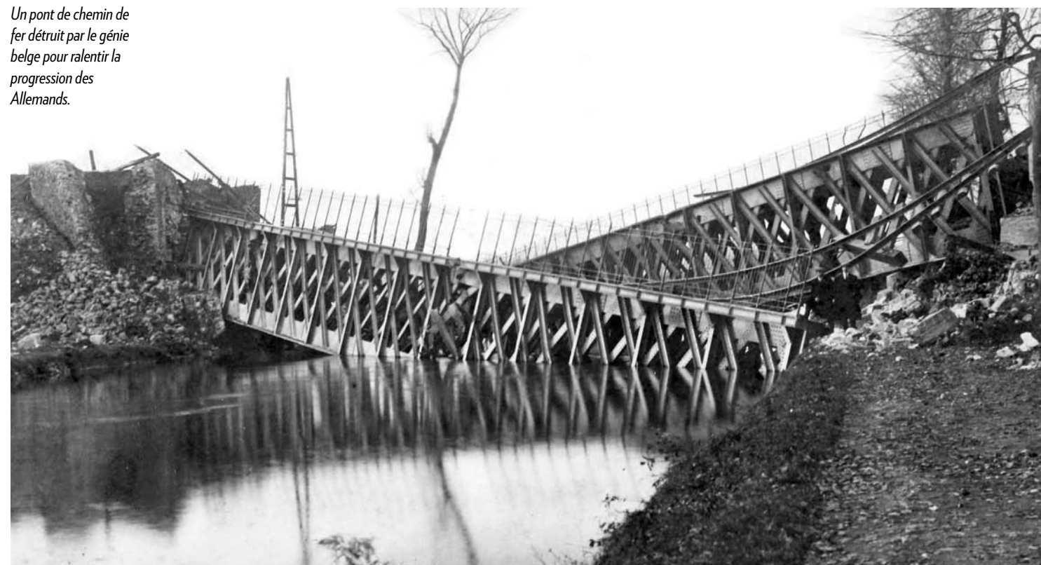
Un pont de chemin de fer détruit par le génie belge pour ralentir la progression des Allemands.

Verviers à Aix-la-Chapelle et de celui de Nasproué (Dison) sur l'axe Liège-Luxembourg, ainsi que de ceux de Trois-Ponts et de Stavelot. Des voies de chemin de fer sont aussi détruites en plusieurs endroits. On provoque des déraillements de locomotives, notamment au niveau des tunnels de Coo, de Roanne, de Remouchamps, de Verviers-Est et de la Sauvenière à Spa. Les ponts sur la Meuse entre Liège et la frontière hollandaise, notamment à Visé et à Argenteau, sont détruits dans la nuit du 3 au 4 août. Sur certaines routes, on place des troncs d'arbre et des éboulis pour contrarier autant que faire se peut l'avancée des troupes allemandes. ■