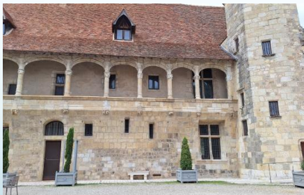
Visite du château musée d'Henri IV à Nérac