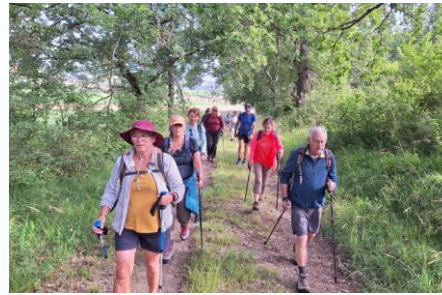
Rando dans les bois à Barbaste