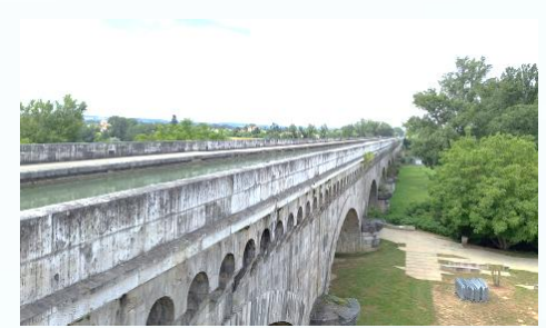
Balade sur le pont canal à Agen