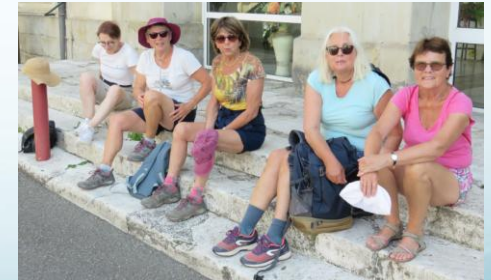
Pause à Villeneuve sur Lot