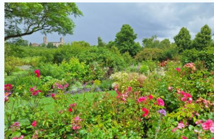
Visite des jardins de Coursiana à La Romieu