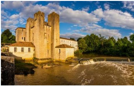
Visite du moulin des Tours d'Henri IV à Barbaste