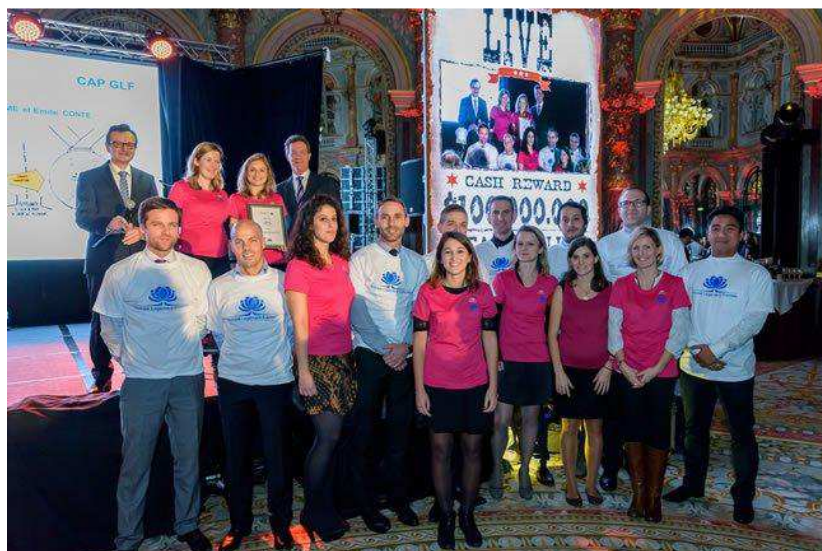
L'équipe projet CAP'Ten Habitat

L'équipe projet travaille aujourd'hui en étroite collaboration avec la direction du Parc du Sausset, les acteurs institutionnels et les associations locales pour que Cap'Ten Habitat soit une réussite.